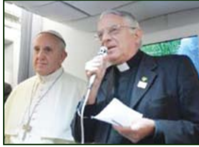
லொம்பார்த்தி விருது வழங்கிக் கொள்கப்படுகிறார்.

அறிவிக்கப்பட்டுள்ளது. மறைமாவட்ட சமூகத் தொடர்புப்பணியாளர்கள், தங்கள் அனுபவங்களை ஒருவர் ஒருவருடன் பகிர்ந்துகொள்ளவும், பொதுத்திட்டங்களில் ஒத்துழைப்பு வழங்கவும் உதவும் நோக்கில் இஸ்ரேலிய ஆயர்களால் ஏற்பாடு செய்யப்பட்டுள்ள இக்கருத்தரங்கு, மறைமாவட்ட அதிகாரப்பூர்வப் பேச்சாளர்களின் முக்கியத்துவத்தையும் வலியுறுத்த உள்ளது. அதன் ஒரு பகுதியாக, திருப்பீடப் பேச்சாளர், இயேசு சபை அருட்தந்தை