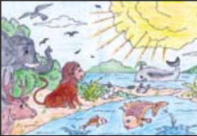
A. ஜெறாட் ரெக்ஸ். திரு சூருதயநாதர் மறைப்பாடசாலை, இராஜகிரிய