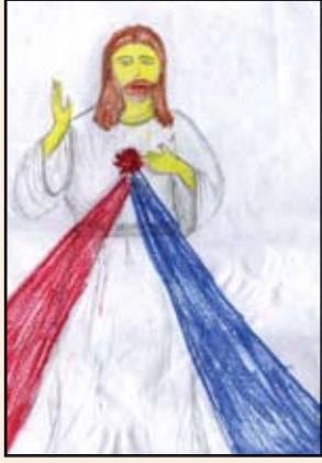
R. டீனோஷா, தரம் - 4. புதுக்கடைப் பங்கு