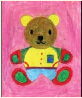
A. வேஜின் அம்ரிதா, தரம் - 1. புதுக்கடைப் பங்கு