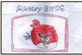
இலேரியன், தரம் - 4. புதுக்கடைப் பங்கு