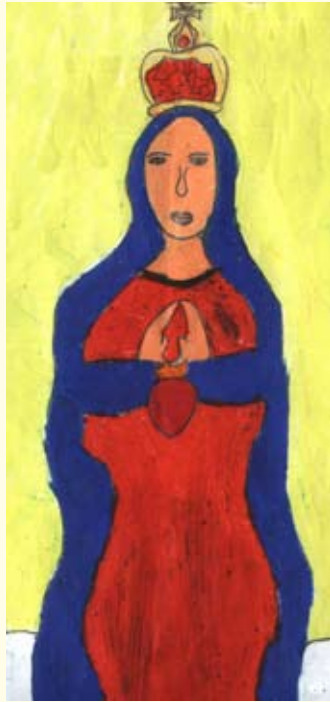
නවිදු පෙරේරා 06 ශ්‍රේණිය සා. රිතා දහම් පාසල - මාවලිය (ඡා-ඇල මිසම)