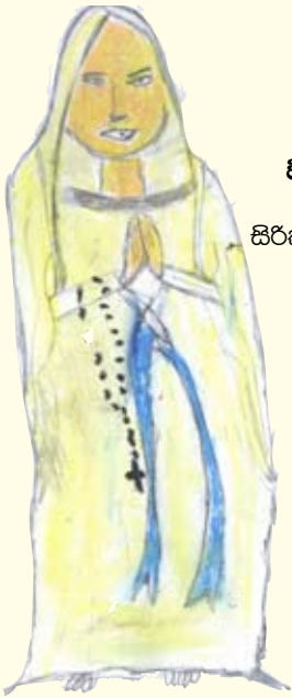
විනෝදී නිමේෂාන් 08 ශ්‍රේණිය සිරිකුරුස දහම් පාසල, මුන්නිකන්තරය

ප්‍රංචි අපේ විග්‍ර පිටුව සඳහා ඔබ අදින විග්‍ර, පාසලේ හෝ දහම් පාසලේ පංතිගාර ඉරතුමාගේ සහතිකය සමඟ ඔබේ නම, පංතිය, පාසල ඇතුළත්ව ඔබේ පෞද්ගලික ලිපිනය හා දුරකතන අංකය ද සහිතව යොමු කරන්න. "ප්‍රංචි අපේ විග්‍ර පිටුව" ළමා ප්‍රදීපය, අංක 02, ඥානාර්ථ ප්‍රදීපය මාවත, කොළඹ 08.