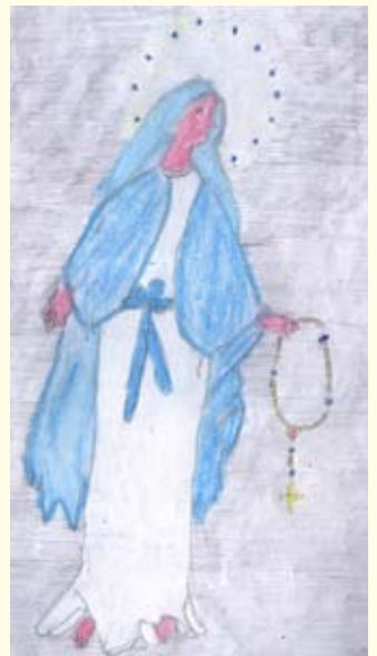
සෙනාල් දිමුතු සංදීප 02 ශ්‍රේණිය පාතිමා දහම් පාසල, යායමුල්ල (වල්පිටගම මිසම)