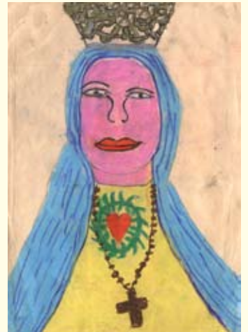
තරුමිකා දෙවිමිණි 02 ශ්‍රේණිය සුරදැතික බාලිකා විදුහල කුලියාපිටිය