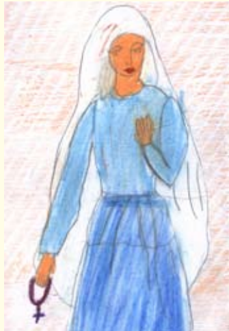
නිසග මනුවර 03 ශ්‍රේණිය සාන්ත අන්තෝනි දහම් පාසල කරණ (මාදම්පේ මිසම)