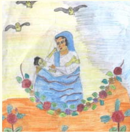
නිරන්ති නිසංසලා 03 ශ්‍රේණිය සාන්ත මරියා ප්‍රාථමික බාලිකා විදුහල - හලාවත